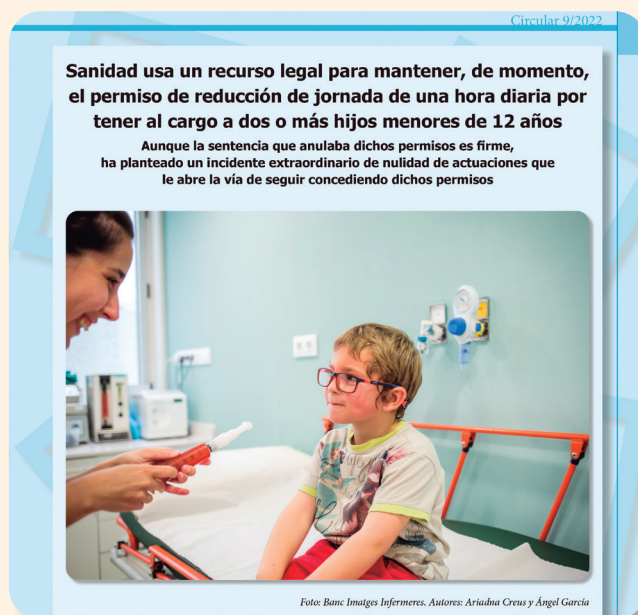
Desde las publicaciones colegiales se ofrece información de los temas tratados con más frecuencia por los asesores